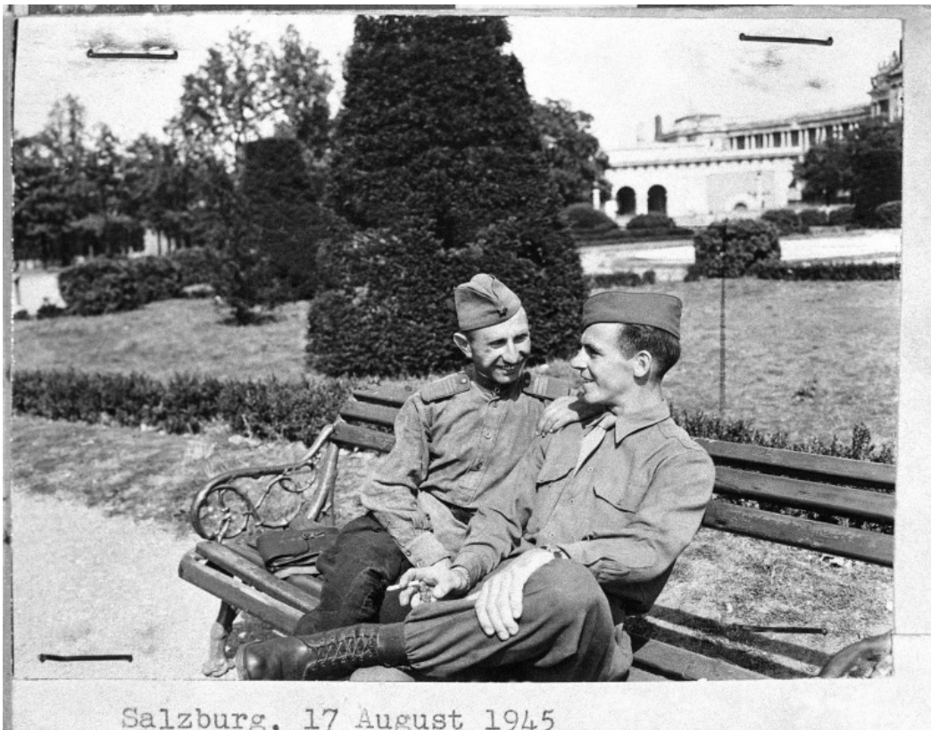
Salzburg, 17 August 1945